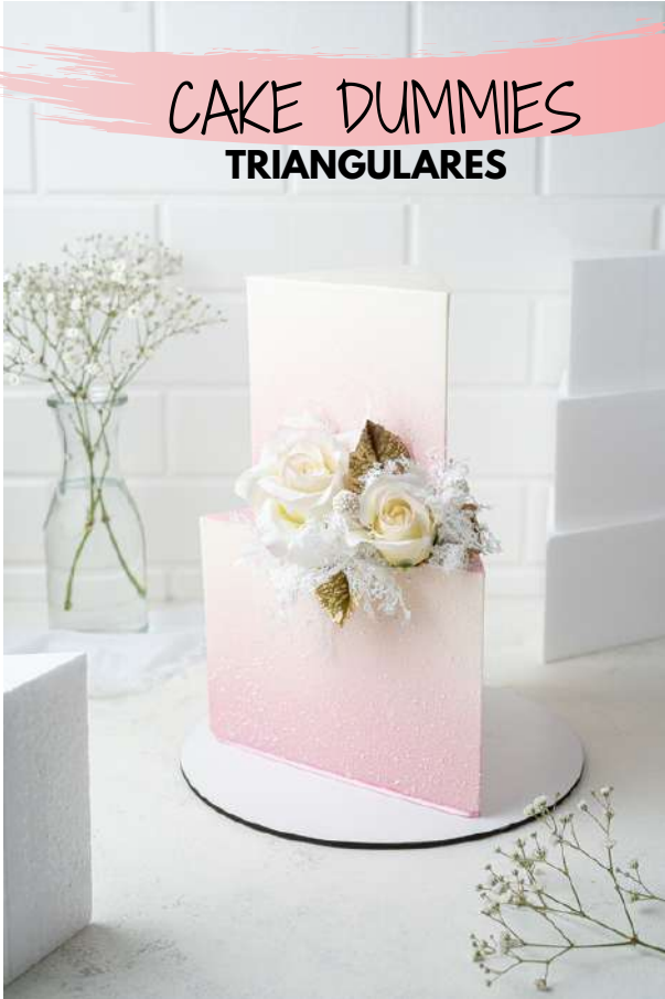
CAKE DUMMIES TRIANGULARES